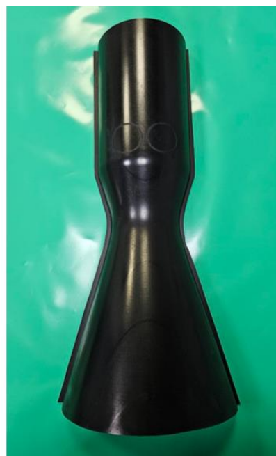
Рисунок 2– Пример готовой оснастки с использованием гелькоута CP200C